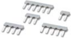
Abbildung zeigt eine Kombination aus den Varianten, EBP 2-5, EBP 3-5, EBP 4-5, EBP 5-5, EBP 6-5

Einlegebrücke, vollisoliert, für Steckverbinder im 5,0 bzw. 5,08 mm Raster, Polzahl: 4