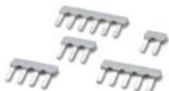
Abbildung zeigt eine Kombination aus den Varianten, EBP 2-5, EBP 3-5, EBP 4-5, EBP 5-5, EBP 6-5

Einlegebrücke, vollisoliert, für Steckverbinder im 5,0 bzw. 5,08 mm Raster, Polzahl: 5