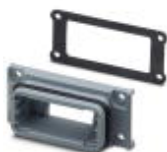
D-SUB-Anbaurahmen, Shell-Größe 1, Schutzart IP67