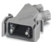
D-SUB-Tüllengehäuse, Schutzart: IP67, Material: PA, Kabelabgang: schräg, Gehäusegröße: 1, Farbe: grau

D-SUB-Tüllengehäuse - VS-09-T-2M16 - 1688353