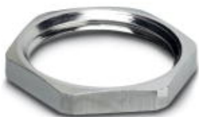
Flachmutter mit Pg13,5-Gewinde

Bitte beachten Sie, dass die hier angegebenen Daten dem Online-Katalog entnommen sind. Die vollständigen Informationen und Daten entnehmen Sie bitte der Anwenderdokumentation. Es gelten die Allgemeinen Nutzungsbedingungen für Internet-Downloads. ( http://phoenixcontact.de/download )