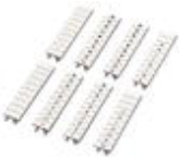
Zackband, bestellbar: streifenweise, weiß, beschriftet nach Kundenangaben, Montageart: verrasten in hoher Schildchennut, für Klemmenbreite: 5,2 mm, Schriftfeldgröße: 5,15 x 10,5 mm

Zackband - ZB 5,LGS:FORTL.ZAHLEN - 1050017