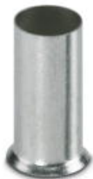
Aderendhülse, Hülsenlänge: 18 mm, Länge: 18 mm, Farbe: silberfarben

Bitte beachten Sie, dass die hier angegebenen Daten dem Online-Katalog entnommen sind. Die vollständigen Informationen und Daten entnehmen Sie bitte der Anwenderdokumentation. Es gelten die Allgemeinen Nutzungsbedingungen für Internet-Downloads. ( http://phoenixcontact.de/download )