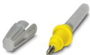
Abbildung zeigt ähnlichen Artikel

Schreibstift, inkl. Adapter, Tuschetank und Aufbewahrungsdepot, 0,25 mm Schriftstärke