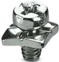
PE- Schraube, für Kontakteinsätze HC-B / HC-BB / HC-DD / HC-D40 / HC-D64

Bitte beachten Sie, dass die hier angegebenen Daten dem Online-Katalog entnommen sind. Die vollständigen Informationen und Daten entnehmen Sie bitte der Anwenderdokumentation. Es gelten die Allgemeinen Nutzungsbedingungen für Internet-Downloads. ( http://phoenixcontact.de/download )