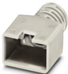
RJ45-Knickschutztülle, für Stifteinsatz VS-08-ST-RJ45, Kabeldurchmesser bis 6 mm, Farbe: grau

Bitte beachten Sie, dass die hier angegebenen Daten dem Online-Katalog entnommen sind. Die vollständigen Informationen und Daten entnehmen Sie bitte der Anwenderdokumentation. Es gelten die Allgemeinen Nutzungsbedingungen für Internet-Downloads. ( http://phoenixcontact.de/download )