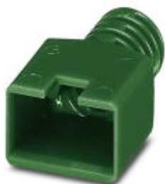
RJ45-Knickschutztüle, für Stifteinsatz VS-08-ST-RJ45, Kabeldurchmesser bis 6 mm, Farbe: grün

Bitte beachten Sie, dass die hier angegebenen Daten dem Online-Katalog entnommen sind. Die vollständigen Informationen und Daten entnehmen Sie bitte der Anwenderdokumentation. Es gelten die Allgemeinen Nutzungsbedingungen für Internet-Downloads. ( http://phoenixcontact.de/download )