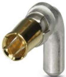
POWER-Kontakt, für D-SUB-Kombinationseinsätze, für Leiterplattenmontage, Buchse, abgewinkelt, Bemessungsstrom 40 A, vergoldet

Bitte beachten Sie, dass die hier angegebenen Daten dem Online-Katalog entnommen sind. Die vollständigen Informationen und Daten entnehmen Sie bitte der Anwenderdokumentation. Es gelten die Allgemeinen Nutzungsbedingungen für Internet-Downloads. ( http://phoenixcontact.de/download )