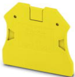
Abschlussdeckel, Länge: 47 mm, Breite: 2,2 mm, Höhe: 39,8 mm, Farbe: gelb

Bitte beachten Sie, dass die hier angegebenen Daten dem Online-Katalog entnommen sind. Die vollständigen Informationen und Daten entnehmen Sie bitte der Anwenderdokumentation. Es gelten die Allgemeinen Nutzungsbedingungen für Internet-Downloads. ( http://phoenixcontact.de/download )