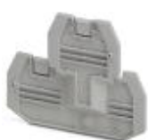
Abschlussdeckel, Länge: 69,9 mm, Breite: 2,2 mm, Höhe: 57,5 mm, Farbe: grau