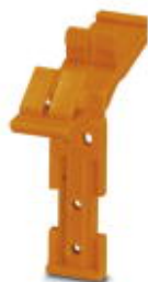
Verrastung, Länge: 39,8 mm, Breite: 10 mm, Polzahl: 2, Farbe: orange

Bitte beachten Sie, dass die hier angegebenen Daten dem Online-Katalog entnommen sind. Die vollständigen Informationen und Daten entnehmen Sie bitte der Anwenderdokumentation. Es gelten die Allgemeinen Nutzungsbedingungen für Internet-Downloads. ( http://phoenixcontact.de/download )