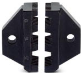
Ersatz-Gesenk für CRIMPFOX 25R

Bitte beachten Sie, dass die hier angegebenen Daten dem Online-Katalog entnommen sind. Die vollständigen Informationen und Daten entnehmen Sie bitte der Anwenderdokumentation. Es gelten die Allgemeinen Nutzungsbedingungen für Internet-Downloads. ( http://phoenixcontact.de/download )