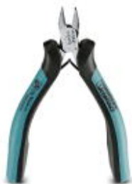
Elektronik-Seitenschneider, spitzer Kopf, abgewinkelt (21°), ohne Fase, mit Öffnungsfeder

Bitte beachten Sie, dass die hier angegebenen Daten dem Online-Katalog entnommen sind. Die vollständigen Informationen und Daten entnehmen Sie bitte der Anwenderdokumentation. Es gelten die Allgemeinen Nutzungsbedingungen für Internet-Downloads. ( http://phoenixcontact.de/download )