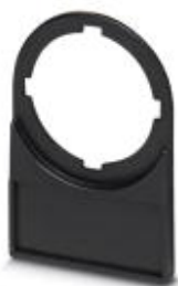
Schildchenträger, schwarz, unbeschriftet, Montageart: Schrauben, Nieten, Durchmesser: 22 mm, Schriftfeldgröße: 27 x 12,5 mm

Bitte beachten Sie, dass die hier angegebenen Daten dem Online-Katalog entnommen sind. Die vollständigen Informationen und Daten entnehmen Sie bitte der Anwenderdokumentation. Es gelten die Allgemeinen Nutzungsbedingungen für Internet-Downloads. ( http://phoenixcontact.de/download )