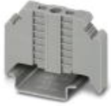
Endhalter, Breite: 9,5 mm, Farbe: grau