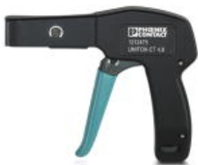
Kabelbinderzange, für Kunststoffkabelbinder mit Breite 2,2 - 4,8 mm, Materialstärke bis 1,6 mm

Bitte beachten Sie, dass die hier angegebenen Daten dem Online-Katalog entnommen sind. Die vollständigen Informationen und Daten entnehmen Sie bitte der Anwenderdokumentation. Es gelten die Allgemeinen Nutzungsbedingungen für Internet-Downloads. ( http://phoenixcontact.de/download )