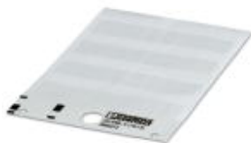
Abbildung zeigt ähnlichen Artikel

Kabelmarker-Etikett, Karte, weiß, unbeschriftet, beschriftbar mit: THERMOMARK PRIME, THERMOMARK CARD, Montageart: kleben, Kabeldurchmesser: ≤36 mm, Schriftfeldgröße: 25 x 25 mm