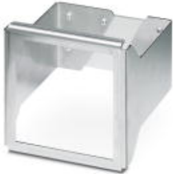
Tragschienenadapter für Energiemessgeräte EEM-MA600 und EEM-MA400

Bitte beachten Sie, dass die hier angegebenen Daten dem Online-Katalog entnommen sind. Die vollständigen Informationen und Daten entnehmen Sie bitte der Anwenderdokumentation. Es gelten die Allgemeinen Nutzungsbedingungen für Internet-Downloads. ( http://phoenixcontact.de/download )