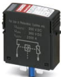
Ersatzstecker für PV-Ableiterkombinationen der Produktfamilie VAL-MS-T1/T2 600DC-PV-...

Bitte beachten Sie, dass die hier angegebenen Daten dem Online-Katalog entnommen sind. Die vollständigen Informationen und Daten entnehmen Sie bitte der Anwenderdokumentation. Es gelten die Allgemeinen Nutzungsbedingungen für Internet-Downloads. ( http://phoenixcontact.de/download )