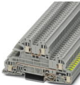
Installationsschutzleiterklemme, Schraubanschluss, Querschnitt: 0,2 mm 2 - 4 mm 2 , AWG: 24 - 12, Breite: 5,2 mm, Farbe: grau, Montageart: NS 35/7,5, NS 35/15

Bitte beachten Sie, dass die hier angegebenen Daten dem Online-Katalog entnommen sind. Die vollständigen Informationen und Daten entnehmen Sie bitte der Anwenderdokumentation. Es gelten die Allgemeinen Nutzungsbedingungen für Internet-Downloads. ( http://phoenixcontact.de/download )