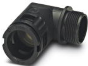
Kabelverschraubung, metrisches Gewinde, Schutzklasse IP68/69k, gewinkelt

Bitte beachten Sie, dass die hier angegebenen Daten dem Online-Katalog entnommen sind. Die vollständigen Informationen und Daten entnehmen Sie bitte der Anwenderdokumentation. Es gelten die Allgemeinen Nutzungsbedingungen für Internet-Downloads. ( http://phoenixcontact.de/download )