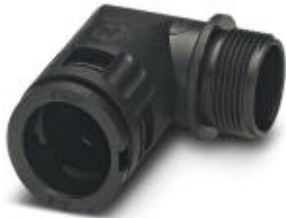
Kabelverschraubung, metrisches Gewinde, Schutzklasse IP66, gewinkelt

Bitte beachten Sie, dass die hier angegebenen Daten dem Online-Katalog entnommen sind. Die vollständigen Informationen und Daten entnehmen Sie bitte der Anwenderdokumentation. Es gelten die Allgemeinen Nutzungsbedingungen für Internet-Downloads. ( http://phoenixcontact.de/download )