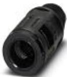
Kabelverschraubung, Pg-Gewinde, Schutzklasse IP66, gerade

Verschraubung - WP-G HF IP66 PG7 BK - 3240888