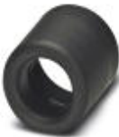
Endtüllen als Kabelschutz

Kabelschutz Endtülle - WP-SC PA HF 10,0 BK - 3240981