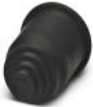
Endtüllen, Übergangstüllen vom Schlauch zu Kabel

Übergangsstülle vom Schlauch zum Kabel - WP-EC TPE HF 10,0 BK - 3240974