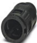
Kabelverschraubung, metrisches Gewinde, Schutzklasse IP66, gerade

Verschraubung - WP-G HF IP66 M10 BK - 3240895