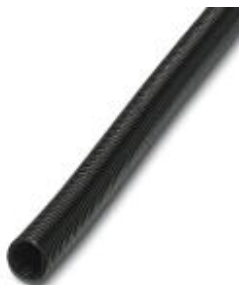
Schutzschlauch aus Polyamid, Brennbarkeitsklasse V0, UV-beständig

Bitte beachten Sie, dass die hier angegebenen Daten dem Online-Katalog entnommen sind. Die vollständigen Informationen und Daten entnehmen Sie bitte der Anwenderdokumentation. Es gelten die Allgemeinen Nutzungsbedingungen für Internet-Downloads. ( http://phoenixcontact.de/download )