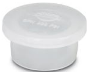
Schutzkappe aus transparentem Kunststoff für QPD-QUICKON-Anschluss 5x 2,5 mm 2 , IP50

Bitte beachten Sie, dass die hier angegebenen Daten dem Online-Katalog entnommen sind. Die vollständigen Informationen und Daten entnehmen Sie bitte der Anwenderdokumentation. Es gelten die Allgemeinen Nutzungsbedingungen für Internet-Downloads. ( http://phoenixcontact.de/download )