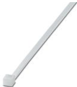
Kabelbinder, Standardversion, für eine schnelle und sichere Bündelung

Bitte beachten Sie, dass die hier angegebenen Daten dem Online-Katalog entnommen sind. Die vollständigen Informationen und Daten entnehmen Sie bitte der Anwenderdokumentation. Es gelten die Allgemeinen Nutzungsbedingungen für Internet-Downloads. ( http://phoenixcontact.de/download )