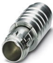
Entriegelungswerkzeug für Kontaktträger zum Einrasten der M23-Signal Gerätesteckverbinder

Bitte beachten Sie, dass die hier angegebenen Daten dem Online-Katalog entnommen sind. Die vollständigen Informationen und Daten entnehmen Sie bitte der Anwenderdokumentation. Es gelten die Allgemeinen Nutzungsbedingungen für Internet-Downloads. ( http://phoenixcontact.de/download )