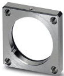
Vierkant-Montageflansch mit O-Ring, O-Ring axial, 4xM3

Bitte beachten Sie, dass die hier angegebenen Daten dem Online-Katalog entnommen sind. Die vollständigen Informationen und Daten entnehmen Sie bitte der Anwenderdokumentation. Es gelten die Allgemeinen Nutzungsbedingungen für Internet-Downloads. ( http://phoenixcontact.de/download )