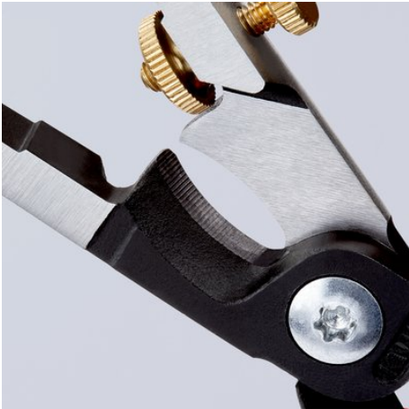
Induktiv gehärtete Präzisionsschneide