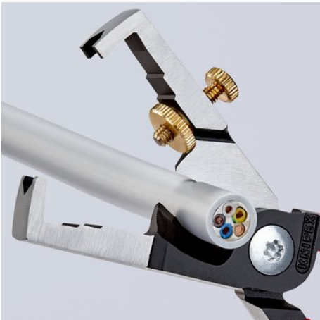
Induktiv gehärtete Scherschneide mit Präzisionsschliff zum quetschfreien Schneiden von Cu- und Al-Kabeln bis Ø 15 mm (5 x 2,5 mm 2 )