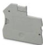
Abschlussdeckel, Länge: 47,6 mm, Breite: 2,2 mm, Höhe: 39,8 mm, Farbe: grau