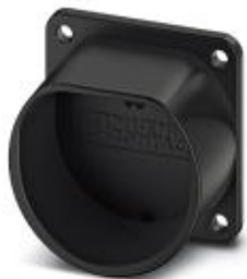
Halterung für Fahrzeug-Ladestecker als Parkposition an Ladestationen (EVSE), Typ 2, IEC 62196-2

Bitte beachten Sie, dass die hier angegebenen Daten dem Online-Katalog entnommen sind. Die vollständigen Informationen und Daten entnehmen Sie bitte der Anwenderdokumentation. Es gelten die Allgemeinen Nutzungsbedingungen für Internet-Downloads. ( http://phoenixcontact.de/download )