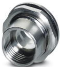
Gehäuseverschraubung, Buchse, M12, Hinterwandmontage, M15 x 1

Bitte beachten Sie, dass die hier angegebenen Daten dem Online-Katalog entnommen sind. Die vollständigen Informationen und Daten entnehmen Sie bitte der Anwenderdokumentation. Es gelten die Allgemeinen Nutzungsbedingungen für Internet-Downloads. ( http://phoenixcontact.de/download )