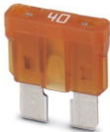
Sicherung, Nennstrom: 40 A, Länge: 19 mm, Breite: 5 mm, Höhe: 18,8 mm

Bitte beachten Sie, dass die hier angegebenen Daten dem Online-Katalog entnommen sind. Die vollständigen Informationen und Daten entnehmen Sie bitte der Anwenderdokumentation. Es gelten die Allgemeinen Nutzungsbedingungen für Internet-Downloads. ( http://phoenixcontact.de/download )