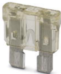
Sicherung, Nennstrom: 25 A, Länge: 19,1 mm, Breite: 5 mm, Höhe: 18,8 mm

Bitte beachten Sie, dass die hier angegebenen Daten dem Online-Katalog entnommen sind. Die vollständigen Informationen und Daten entnehmen Sie bitte der Anwenderdokumentation. Es gelten die Allgemeinen Nutzungsbedingungen für Internet-Downloads. ( http://phoenixcontact.de/download )