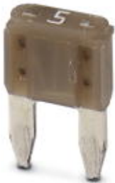
Sicherung, Nennstrom: 5 A, Länge: 11,9 mm, Breite: 3,8 mm, Höhe: 16,2 mm

Bitte beachten Sie, dass die hier angegebenen Daten dem Online-Katalog entnommen sind. Die vollständigen Informationen und Daten entnehmen Sie bitte der Anwenderdokumentation. Es gelten die Allgemeinen Nutzungsbedingungen für Internet-Downloads. ( http://phoenixcontact.de/download )