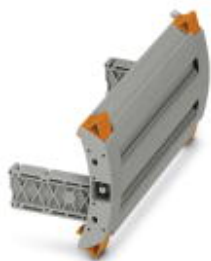
Blindstecker, Rastermaß: 8,2 mm, Länge: 163 mm, Breite: 73,4 mm, Polzahl: 16, Farbe: grau

Bitte beachten Sie, dass die hier angegebenen Daten dem Online-Katalog entnommen sind. Die vollständigen Informationen und Daten entnehmen Sie bitte der Anwenderdokumentation. Es gelten die Allgemeinen Nutzungsbedingungen für Internet-Downloads. ( http://phoenixcontact.de/download )