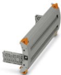
Blindstecker, Rastermaß: 8,2 mm, Länge: 220,1 mm, Breite: 73,4 mm, Polzahl: 23, Farbe: grau

Bitte beachten Sie, dass die hier angegebenen Daten dem Online-Katalog entnommen sind. Die vollständigen Informationen und Daten entnehmen Sie bitte der Anwenderdokumentation. Es gelten die Allgemeinen Nutzungsbedingungen für Internet-Downloads. ( http://phoenixcontact.de/download )