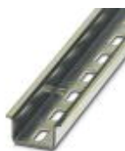
Tragschiene gelocht, Standardprofil, Breite: 35 mm, Höhe: 15 mm, ähnlich EN 60715: 2001, Material: Stahl, verzinkt, dickschichtpassiviert, Länge: 2000 mm, Farbe: silberfarben

Tragschiene gelocht - NS 35/15 PERF 2000MM - 1201730