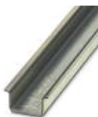
Tragschiene ungelocht, Standardprofil, Breite: 35 mm, Höhe: 15 mm, ähnlich EN 60715: 2001, Material: Stahl, verzinkt, dickschichtpassiviert, Länge: 2000 mm, Farbe: silberfarben

Tragschiene ungelocht - NS 35/15 UNPERF 2000MM - 1201714