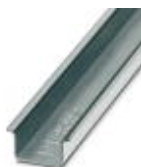
Tragschiene ungelocht, Standardprofil, Breite: 35 mm, Höhe: 15 mm, ähnlich EN 60715: 2001, Material: Stahl, verzinkt, weiß-passiviert, Länge: 2000 mm, Farbe: weiß

Tragschiene ungelocht - NS 35/15 WH UNPERF 2000MM - 1204135