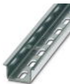
Tragschiene gelocht, Standardprofil, Breite: 35 mm, Höhe: 15 mm, ähnlich EN 60715: 2001, Material: Stahl, verzinkt, weiß-passiviert, Länge: 2000 mm, Farbe: weiß

Tragschiene gelocht - NS 35/15 WH PERF 2000MM - 0806602