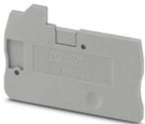
Abschlussdeckel, Länge: 53,5 mm, Breite: 2,2 mm, Höhe: 35,1 mm, Farbe: grau

Bitte beachten Sie, dass die hier angegebenen Daten dem Online-Katalog entnommen sind. Die vollständigen Informationen und Daten entnehmen Sie bitte der Anwenderdokumentation. Es gelten die Allgemeinen Nutzungsbedingungen für Internet-Downloads. ( http://phoenixcontact.de/download )