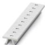
Zackband, Streifen, weiß, beschriftet, beschriftbar mit: CMS-P1-PLOTTER, längs bedruckt: gleiche Zahlen 1 oder 2 usw. bis 100, Montageart: verrasten in hoher Schildchennut, für Klemmenbreite: 5,2 mm, Schriftfeldgröße: 5,15 x 10,5 mm

Zackband - ZB 5,LGS:GLEICHE ZAHLEN - 1050033