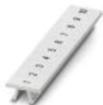
Zackband, Streifen, weiß, beschriftet, längs bedruckt: fortlaufende Zahlen 1-10, 11-20 usw. bis 491-500, Montageart: verrasten in hoher Schildchennut, für Klemmenbreite: 5,2 mm, Schriftfeldgröße: 5,15 x 10,5 mm

Zackband - ZB 5,LGS:FORTL.ZAHLEN - 1050017