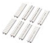
Zackband, bestellbar: streifenweise, weiß, beschriftet nach Kundenangaben, Montageart: verrasten in hoher Schildchennut, für Klemmenbreite: 5,2 mm, Schriftfeldgröße: 5,15 x 10,5 mm

Zackband - ZB 5,LGS:FORTL.ZAHLEN - 1050017