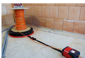
RM35 mit Gurt und Clip-System an XB 500 befestigt