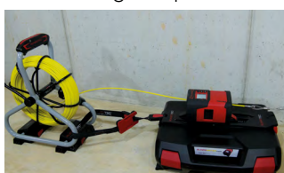
RM35 mit Montageplatte-Systemkoffer, Glasfasereinzehsystem Ø 4,5 mm