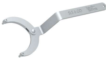
SLS 6G, Gelenksterinlochschlüssel