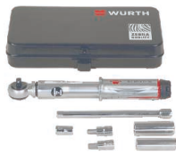
WKZ U, Universelles Werkzeugset