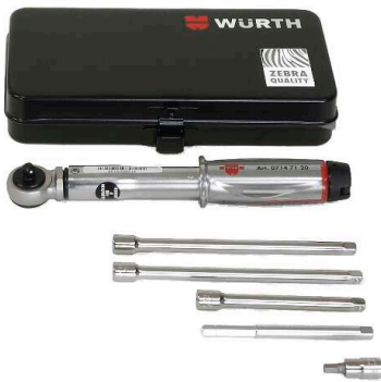
HSI150 DG/HRK SSG WKZ, Werkzeugset für HSI150 DG/HRK SSG